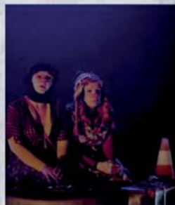
Théâtre de la bulle Tarbes